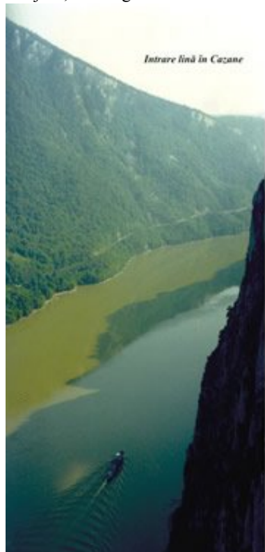
Intrare lină în Cazane

Dunav predstavlja južni limit čiji je protok od 5400 mc/s kod Bazjasa, mesto gde Dunav ulazi na teritoriju Rumunije.