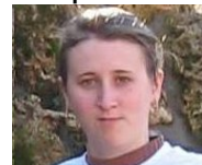
SOFICA CIOSA Gimnazija "Eftimie Murgu" Bozovic