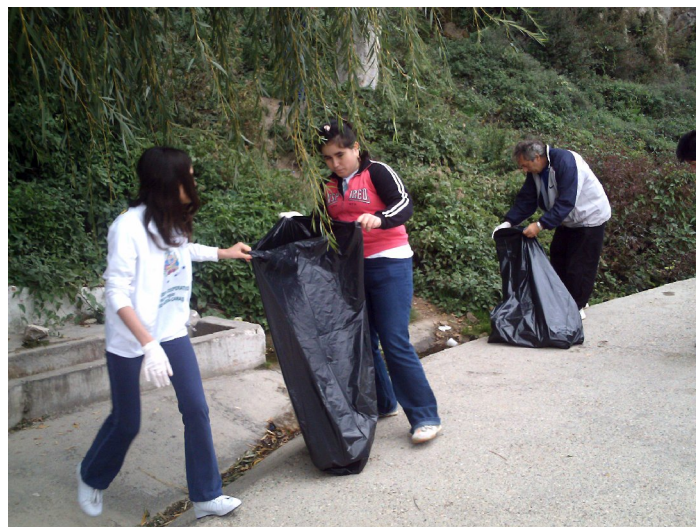
Volonteri Hemijske i medicinske gimnazije Vrsac – očistite turistički punkt Muvina rupa (Gaura cu Musca – Coronini) nedaleko od naselja Coronini.

Podsecamo saradnike GEK Nere da se legitimacija volontera stice samo nakon specijalne obuke. Tom prilikom, kandidati za volontere, bice upoznati sa specifičnim aktivnostima koje će u narednom periodu ostvarivati. Nevladine organizacije (ONG) škole koje žele da uključe volontere u projekte koje će GEK Nera implementirati 2008. godine, mogu organizovati obuku u periodu od decembra 2007. do februara 2008. Teme obuke koje će proslediti GEK Nera, srednjeg su stepena težine, a mogu ih obraditi stručni lektori (profesori) iz organizacija učesnika.