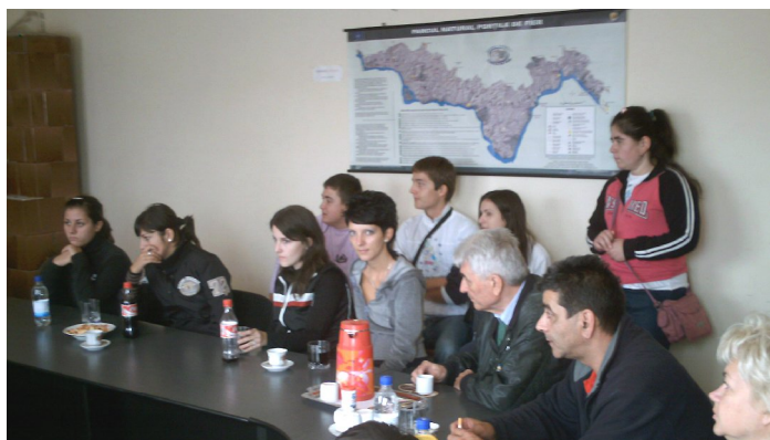
Okrugli sto u Opštini Sikevica (Sichevita) kad je u pitanju ekoturizam u Dunavskoj Klisuri