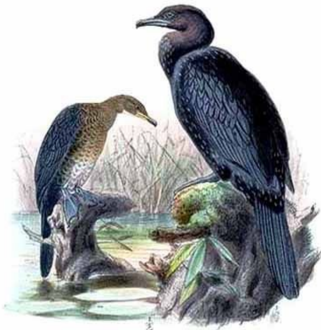
Mali vranac (Phalacrocorax pygmaeus)

Na pašnjacima dominantnu vegetaciju predstavlja Trifolio – Agrostietum stoloniferae. Pašnjaci zauzimaju značajne površine ravničarske zone naselja Stefanovo u podnožju peščanih dina.