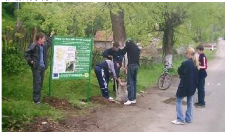
Volonteri škole iz Novog Sipta postavljaju pano o ekoturističkom informisanju

Aktivnosti koje će biti ostvarene 2008. od strane volontera iz prekograničnog centra GEK Nera, odvijace se u zoni prirodnih parkova Portile de Fier, Klisura Nera – Beusnica, Daliblatska Pescara i Vrsacke Planine. Aktivnosti volontera imaju u vidu alternativnu monitorizaciju sredine koja će se ostvarivati u saradnji sa upravama parkova i regionalnim zupanijskim vlastima za zastitu sredine.