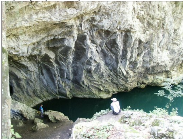
Misteriozni svet iz Davoljeh jezera

nas preko manjih vodopada do balkona koji se otvaraju nad vodom pružajući posetiocu predivni vidik.